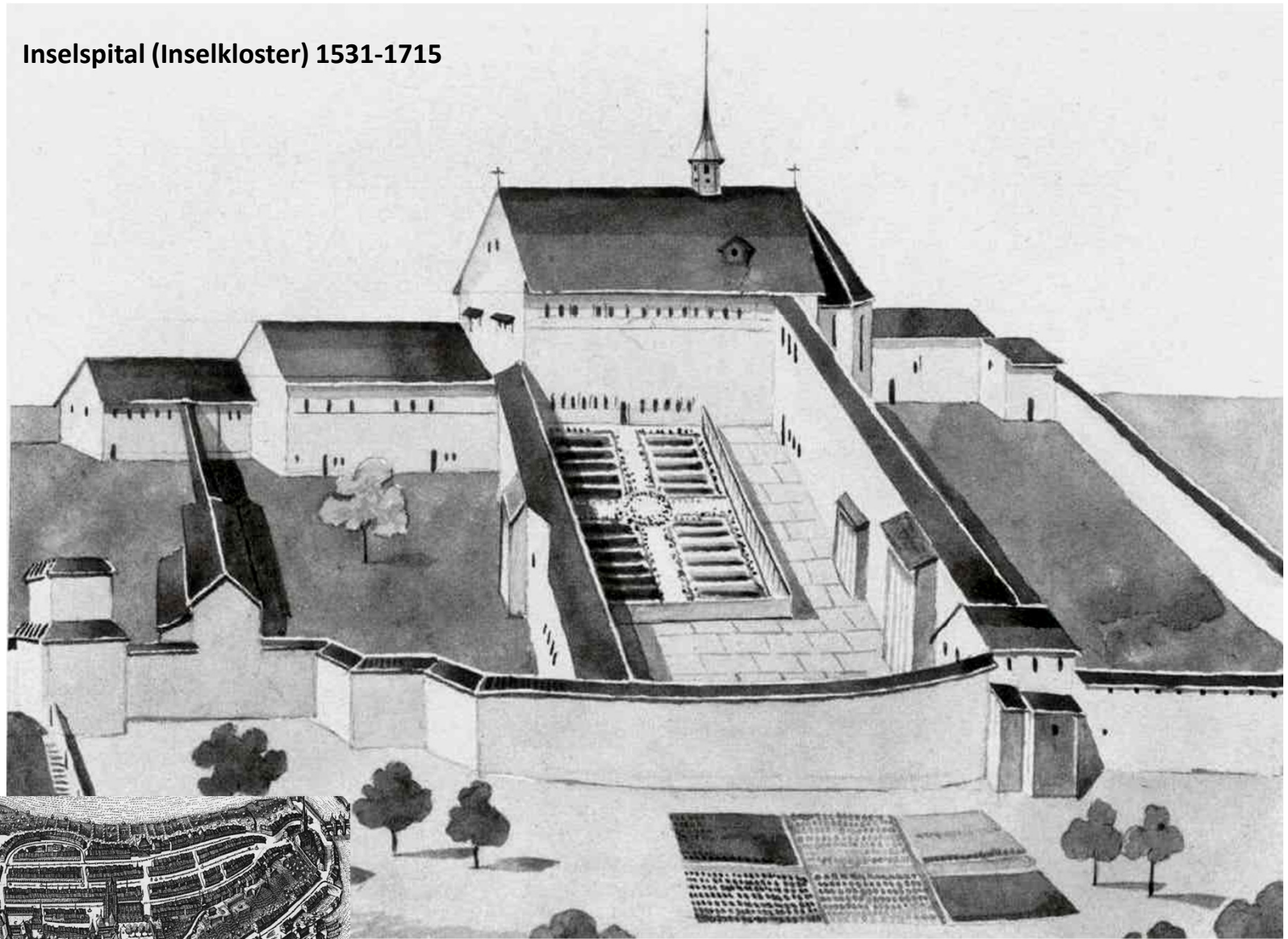
Inselspital (Inselkloster) 1531-1715